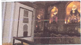
Enterramientos en las columnas dentro de la Iglesia Santo Domingo.