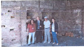
Nichos aun utilizados por la Iglesia de Santo Domingo.