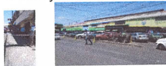
12 ave y 5 calle.