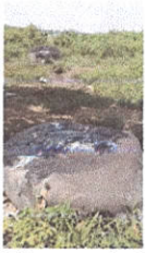
Figura 1. Monumento 2 y 3.