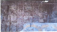
Cementerio detrás de la Capilla de Jesús Sepultado de la Iglesia de Santo